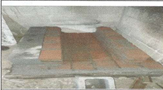
Foto1: Construcion de planchas